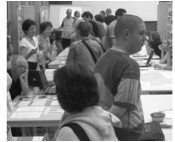
Praxisbörse: Kommunikativer Austausch zwischen Praxisstellen und Studierenden