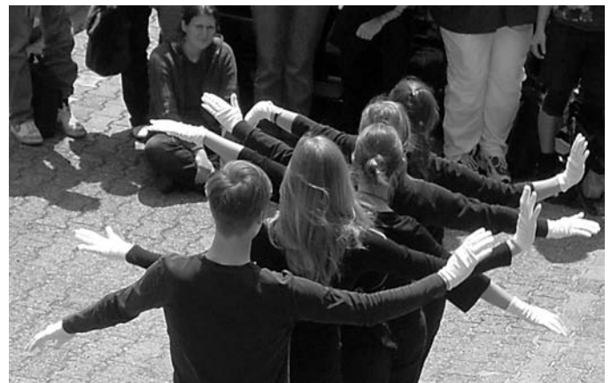
Studien-Performance: Das Eigene und das Fremde

Schließlich beginnt ein neuer Bachelorstudiengang, für den es einen großen Bedarf gibt: die Einrichtung eines Studiengangs zur akademischen Qualifizierung von Erzieherinnen. Nach intensiver Entwicklungsarbeit ist es gelungen, den Forderungen aus Pisa-Diskussionen gerecht zu werden. Wer diese Ausbildung absolviert, qualifiziert sich doppelt: Er bzw. sie erwirbt den staatlich anerkannten Abschluss als Erzieher und einen Bachelor of Arts. Das Studium dauert mit integrierten Praxisphasen insgesamt vier Jahre. Es verbindet den Praxisbezug mit dem Wissenschaftsbezug und erfüllt den heutigen