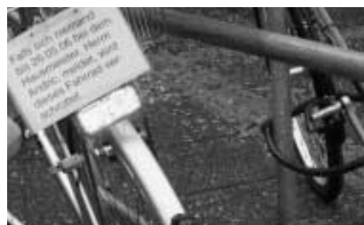
Das Ende eines Standpunktes

Volker Herrmann / Martin Horstmann (Hrsg.) Studienbuch Diakonik Bd. 1: Biblische, historische und theologische Zugänge zur Diakonik 364 S., 29,90 €, ISBN 3-7887-2156-1 Bd. 2: Diakonisches Handeln – diakonisches Profil – diakonische Kirche 348 S., 29,90 €, ISBN 3-7887-2157-X; Beide Bände zusammen 49,90 €, Neukirchener Verlag, Neukirchen-Vluyn 2006.