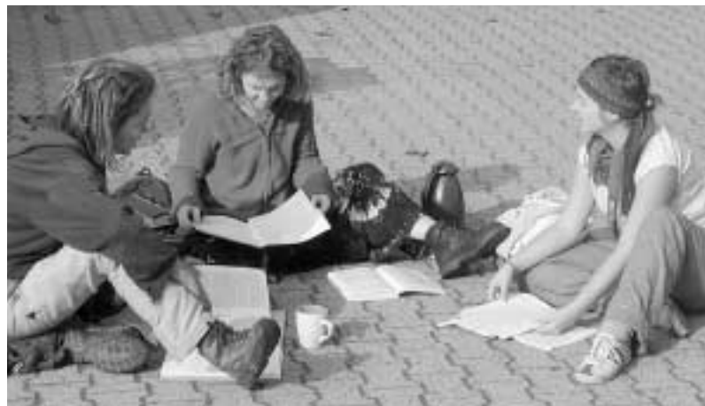
Lernen mit Bodenhaftung

Bachelor oder Diplom? scheint wie der Vergleich von Äpfel und Birnen. Beides ist Obst und doch schwer vergleichbar. Und den Menschen, die Unterstützung brauchen, wird es egal sein, wie das Studium hieß. Entscheidend ist die Qualität der Dienstleistung. ■