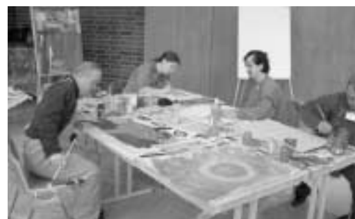
Konzentration und Kreativität