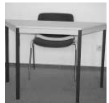
Opfer der Autonomie