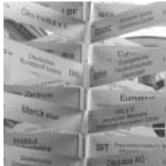
EFH als Teil der Wissenschaftsstadt

Neben räumlichen barrierefreien Konzepten wurde unter Zuhilfenahme und Einbau elektronischer Innovationen ein Umfeld geschaffen, das pflegewissenschaftliche Konzepte zur Versorgung und Begleitung älterer gesunder Menschen und Menschen mit Behinderungen und/oder altersdementer Menschen und gleichzeitig ihrer Lebenspartner ermöglicht. So ist neben den barrierefreien Wohnungen einer Kurzzeitpflegeeinrichtung, einer Demenz-Wohngemeinschaft auch eine Tagespflegeeinrichtung und eine Kindertagesstätte vorgesehen. Inzwischen haben sich schon mehrere Investoren für die Projektierung dieses Konzepts interessiert. ■