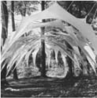
Kathedrale des Lichts bei Tag

die Zuschauer fasziniert und ihre Aufmerksamkeit gebunden. Irrlichter blinken aus dem Nebel. Zur melancholischen Musik enthüllt langsam das Licht tanzende menschliche Körper. Der Nebel zerreißt bei den heftigen Bewegungen und gibt den Blick frei auf tanzende Insekten. Erschrocken ziehen sie sich hinter die Bäume zurück. Die Glühwürmchen begleiteten die deutlich enthusiastische Besuchergruppe aus dem Wald in die kalte Welt des Asphalts. ■