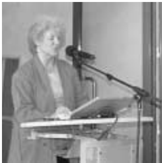
Die Straße als alternativer Hörsaal

dem Gesichtspunkt, Mobilität im Alter zu erhalten, Gesundheit zu fördern, soziale Kontakte zu ermöglichen und die durch das zunehmend hohe Alter entstehenden Einschränkungen unterschiedlichster Kompetenzen aufzufangen, entwickelte die Gruppe intensiv Wohnkonzepte, die