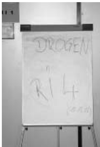
Die neue Ehrlichkeit?

Hochschulrankinglisten werden zwar zur Unterhaltung gelesen, aber deren Botschaften nicht befolgt. Zu diesem Ergebnis kommen Forscher des Hochschul-Information-Systems in Hannover. Dies kann die EFH nicht bestätigen. Seit Jahren werden im Studiengang Soziale Arbeit deutlich mehr BewerberInnen zugelassen als Studienplätze vorhanden sind. Da nicht alle den Studienplatz annehmen oder nicht zur Immatrikulation erscheinen, hat sich am Ende die gewünschte Zahl eingependelt. Doch nach dem Erscheinen des Stern - Ranking im letzten Jahr, bei dem die EFH