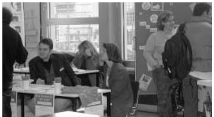
Praktikumsbörse: Suche - Biete