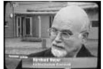
Hessenfernsehen informiert sich