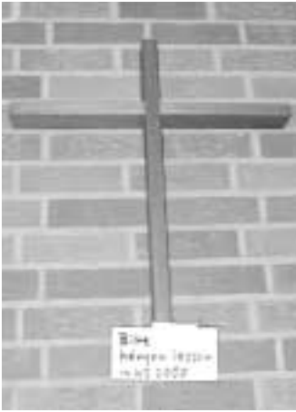
Ein Kreuz mit der Ablage