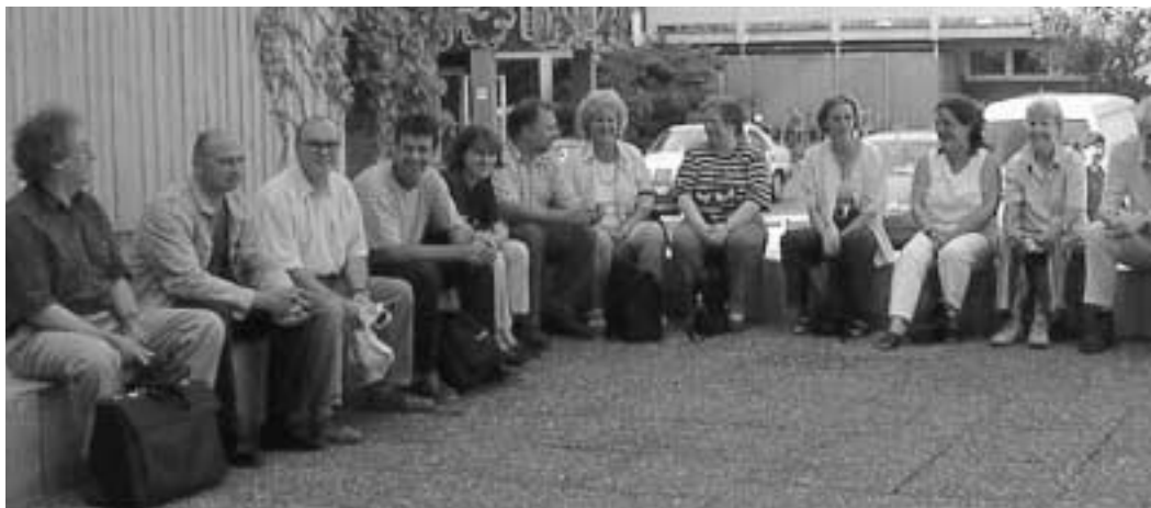
Warten auf das Jubiläum